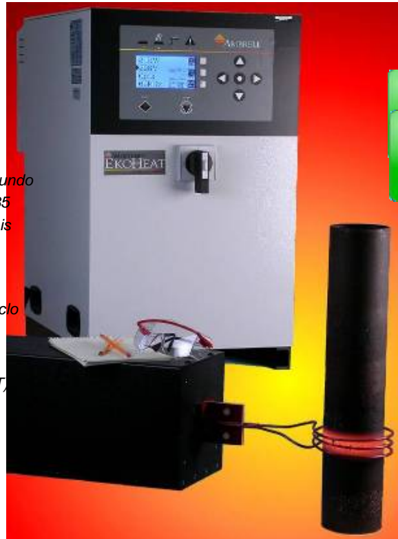
A linha EKOHEAT possui a certificação CE, sendo produzida em nossa fábrica também com certificação ISO 9001:2008

Os sistemas de aquecimento por indução EKOHEAT para a faixa de 50-150 kHz, oferecem soluções confiáveis e repetitivas para aquecimento de peças menores em alta velocidade, onde a geometria da peça ou o tamanho da bobina exigem alta frequência para um aquecimento eficiente. As diversas aplicações normais incluem tratamento térmico de aços, endurecimento de camada fina de superfície, aquecimento de aço, alumínio, cobre, latão para brasagem, ajuste por encolhimento, cura, moldagem e fusão, entre muitas outras.