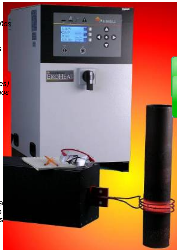
EKOHEAT lleva el distintivo CE y las instalaciones de fabricación están certificadas según la norma ISO 9001:2008

Los sistemas de calentamiento por inducción EKOHEAT para el rango de 50 a 150 kHz proporcionan soluciones confiables y repetibles para el calentamiento de alta velocidad de piezas pequeñas, donde el diseño de la pieza o el tamaño de la bobina exigen el uso de alta frecuencia para proporcionar un calentamiento eficaz. Entre sus muchas aplicaciones típicas están el tratamiento térmico de aceros, el endurecimiento de superficies de poca profundidad y el calentamiento de acero, aluminio, cobre o bronce para soldadura fuerte, ajuste por contracción, recuperación, moldeado y fusión.